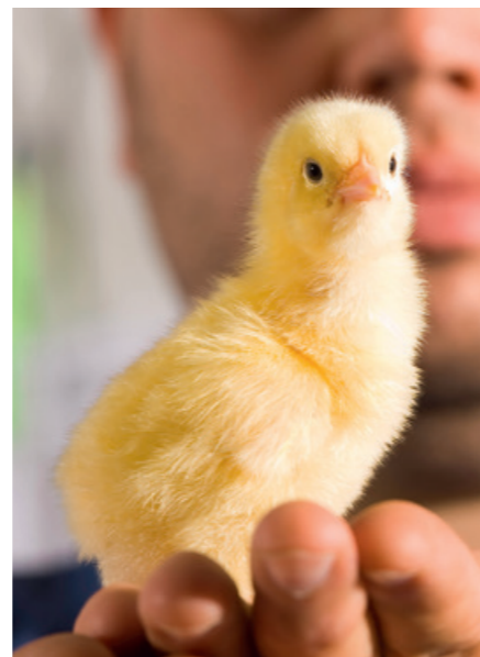
BD France est spécialiste en production d'œufs à couvrir et de poussins d'un jour type chair grâce à ses filiales Josset/Avi-Loire et Goasduff.

L'objectif de BD France est de devenir un partenaire privilégié de la filière avicole française grâce à la qualité de ses produits et de devenir le couvoir indépendant n°1 en France, avec 20 à 25 % du marché de poulets de chair. La qualité des poussins d'un jour est donc privilégiée. En outre, la diversité des souches proposées (standard, certifié, label et biologique) permet de répondre à la segmentation croissante de la demande des consommateurs.