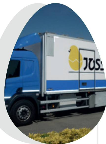
Une flotte de camions dédiée pour une flexibilité et une livraison optimisées